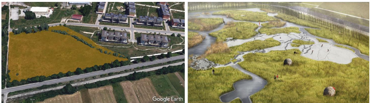
Fig. 2. Area di intervento (sinistra). Esempio di soluzione progettuale. Fonte: Studio Marco Vermeulen, Inundatiepark West- Brabantse Waterlinie, Halsteren (destra).