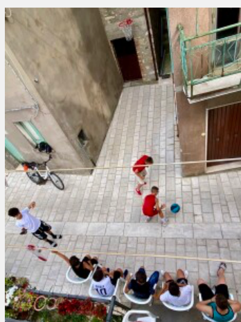
Montefalcone, bambini giocano in strada

Raramente il "prodotto tipico" va oltre le esigenze di distinzione culturale della borghesia alternativa, attirata più che altro dalla connotazione ideologica di piaceri enogastronomici che ammiccano a una lontananza, spesso di facciata, dall'economia neoliberista. Per tutto il resto, volenti o nolenti, viviamo in un sistema di consumo dove il grosso della spesa si fa attaccati in massa alla mammella tossica dell'estrattivismo agroindustriale delle multinazionali che dominano la grande distribuzione alimentare e che non gradiscono altre compagnie. Non dimentichiamo che la grande industria alimentare globalizzata subirebbe un danno mortale se la produzione di cibo si rilocalizzasse nei territori, e proprio per questo preferisce e necessita che gli ambiti locali restino degli spazi di consumo, che non riprendano a produrre seriamente.