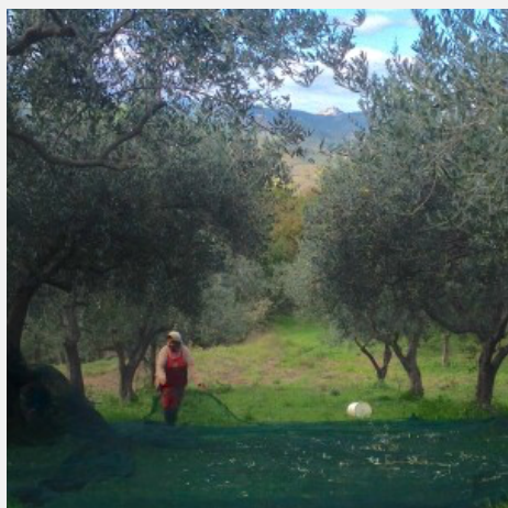
Nicoletta stende le reti per raccogliere le olive, 2016

paesi remoti che, prima della “via della cantina”, c'è la possibilità e il bisogno, per loro e per il paese e per il mondo, della “via della vigna”. Si riuscirà a trasformare questo impellente bisogno sociale in un diffuso desiderio individuale? [2]