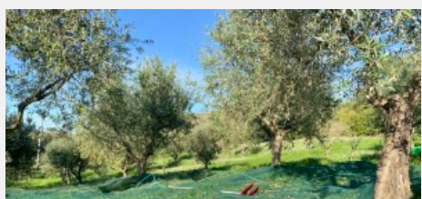
Gli ulivi pronti per la raccolta

In via del tutto teorica e a livello più generale possibile: se il potenziale turistico di tutti i luoghi del mondo fosse analogo, si creerebbe uno scambio alla pari generalizzato che inficerebbe la stessa idea di luogo turistico. A un livello più pratico: la bellezza dei luoghi è classificabile in un continuum tra due estremi, dove in alcuni posti vorrebbero andare tutti e in altri non vorrebbe andare nessuno. E la maggior parte dei paesi delle aree interne italiane hanno potenzialità medie, e comunque non tali da poter suggerire rinascite turistiche. In questi casi si può dare certamente una mano ai luoghi se si fa in modo che possano attrarre qualcuno, che sia qualcuno oltre agli oriundi che tornano per qualche giorno l'anno; ma non si può sperare che così si possano salvare tutti i paesi che oggi sono sull'orlo del collasso sociale. È che l'idea diffusa che l'isolamento conservi il fascino, che il paese remoto sia di per sé un paese bello, non sempre è valida: alcune volte è così, ma molti paesi remoti sono meno attrattivi (sia in senso storico-artistico-architettonico che paesaggistico) di come a volte li immaginano gli abitanti, e rispetto a come vengono raccontati da politici e intellettuali.