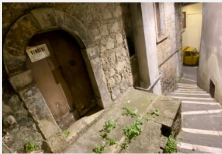
Montefalcone, paese e spopolamento

In tanti paesi minori e più compromessi delle aree interne il discorso sul turismo finisce con il funzionare solo come deus ex machina con cui si rimuove il problema dell'abbandono agricolo, il suo legame con lo spopolamento, proiettandolo su una soluzione vana, che viene proposta da intellettuali, politici e artisti vari, i quali, in fondo, più che ad aiutare i paesi, pensano ad aiutare se stessi, trovando in tali circostanze la possibilità remunerata di interpretare il ruolo di paladini. Il tutto in un triangolo drammatico in cui questi operatori dell'immateriale salvano il paese-vittima dal neoliberalismo-carnefice, trasformando in patrimonio ciò prima che era marginalità e conducendo gli abitanti alla conquista del benessere, dell'agiatezza, nel paese reso finalmente Eden turistico.