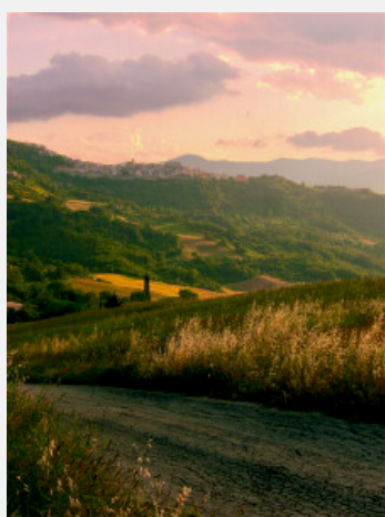
Paese e paesaggio agrario collinare molisano