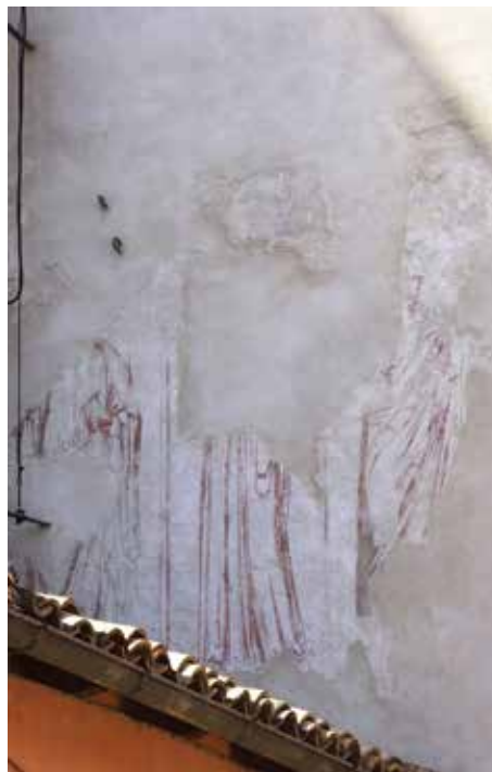
Fig. 3 - Sulmona, San Francesco della Scarpa, Tre santi, testata del braccio sinistro del transetto.

circulum precatorium può forse identificarsi col beato Gerardo da Valenza, devotissimo a Ludovico di Tolosa, il culto del quale contribuì a propagare in Sicilia. 16