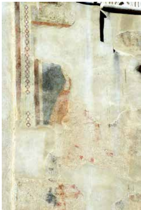
Fig. 2 - Sulmona, San Francesco della Scarpa, Santa (Maddalena?), pilastro all'ingresso dell'abside sinistra.