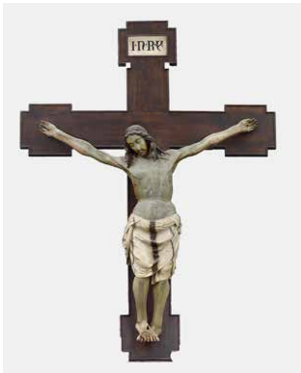
Fig. 9 - Maestro di Campo di Giove (Nicola Olivieri da Pietransieri?), Crocifisso ligneo, Sulmona, San Francesco della Scarpa.

dovico di Tolosa, l'unica opera superstite riconducibile ai primi due secoli dell'insediamento minoritico a Sulmona sembra costituita dallo stupendo Crocifisso tardo-gotico intagliato e dipinto (h cm 180) sospeso davanti all'altare maggiore (fig. 9). Prima della Seconda guerra mondiale la sua presenza in chiesa è segnalata sul muro della controfacciata, a destra. 41 Liberato dalle ridipinture, il manufatto appare modellato sui Crocifissi riferiti al Maestro di Visso/Maestro della Croce di Trevi 42 per l'inclinazione accentuata del capo che determina la ricaduta in avanti della capigliatura, per la morbidezza del modellato, per la forma arrotondata del ventre, per la lunghezza del perizoma elasticamente aderente alle ginocchia. Da quegli esemplari il Crocifisso di