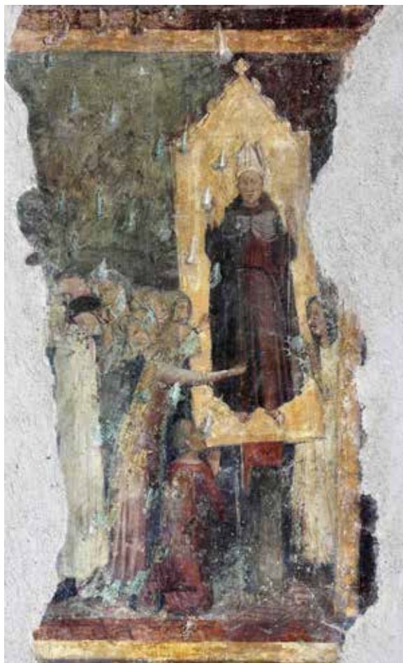
Fig. 6 - Maestro di Fossa, Adorazione dell'icona di San Ludovico , Sulmona, San Francesco della Scarpa, controfacciata, particolare delle Opere e miracoli di San Ludovico di Tolosa.

Di particolare importanza è la scena con l' Adorazione dell'icona di san Ludovico, plausibile indizio dell'esistenza in chiesa di una vera e propria pala d'altare che lo ritraeva a figura intera (fig. 6). 26 Quadro nel quadro, la 'finta' tavola doveva suscitare viva impressione nei fedeli, anche perché il fondo era probabilmente rivestito da una lamina metallica meccata in modo da simulare l'oro, secondo quanto si evince dall'incisione dei contorni della figura del santo e dei profili femminili interferenti con l'icona.