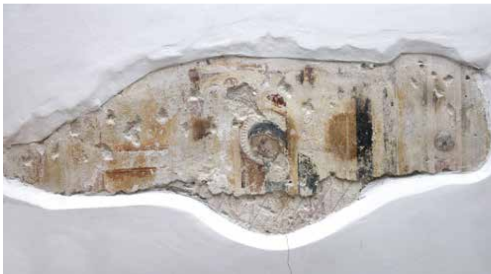
Fig. 7 - Maestro di Beffi (Leonardo di Sabino da Teramo?), Annunciazione (?), Sulmona, San Francesco della Scarpa, sacrestia destra, sala superiore.