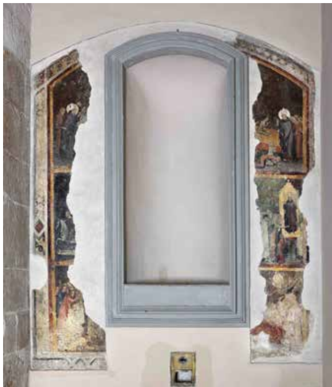
Fig. 5 - Maestro di Fossa, Opere e miracoli di San Ludovico di Tolosa (1350-1360), Sulmona, San Francesco della Scarpa, controfacciata.

Scialbato dopo il terremoto del 1706, il dipinto murale è prodotto di palpitante qualità pittorica da doversi ricondurre a personalità di prim'ordine della 'scuola' spoletina, ovvero sia all'attività del Maestro di Fossa negli anni Cinquanta del Trecento – quando a Sulmona sono documentati numerosi abitanti provenienti da Spoleto, Norcia, Foligno. 24