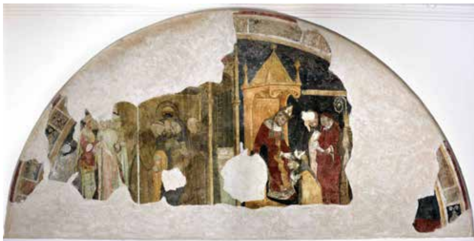
Fig. 4 - Pittore abruzzese dell'ultimo quarto del secolo XIV, Professione segreta di Ludovico d'Angiò e sua consecrazione a vescovo di Tolosa , Sulmona, San Francesco della Scarpa, sacrestia sinistra, sala superiore.

Una data a cavallo fra l'ottavo e il nono decennio del Trecento è consigliata anche dall'abbigliamento del laico con barba appuntita e copricapo a cuffia effigiato all'estrema sinistra della lunetta, che indossa una mantellina con affrappature sopra una gonnella cortissima e attillata, con cappuccio e con maniche strette e svasate sul polso, scarsella alla cintura bassa sui fianchi e calze aderenti. 23