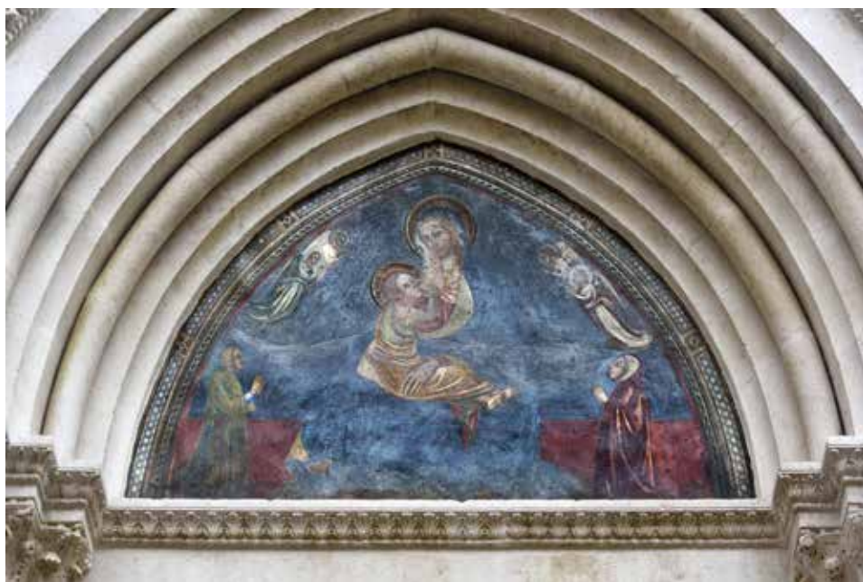
Fig. 8 - Pittore abruzzese dell'ultimo quarto del secolo XIV, Madonna dell'Umiltà con i donatori . Sulmona, San Francesco della Scarpa, lunetta del portale di facciata.