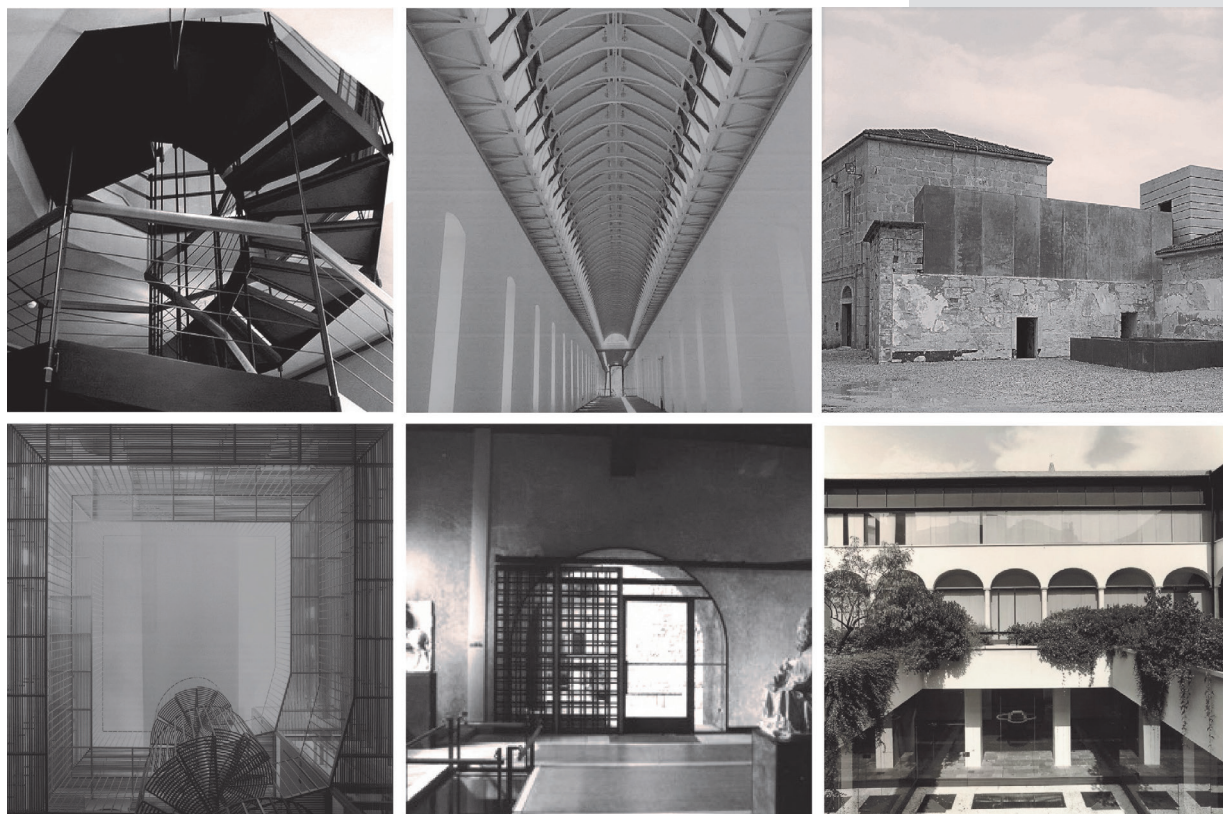
Figure 3. Highlighting Gradient: by single or dilated items, by repeated or multiple elements, by a system of fragments or extruded volumes.

Lo svelamento diffuso ricorre anche ad elementi metallici molteplici che, pur preferendo la variazione alla ripetizione, sono percepiti come parte di un disegno progettuale unitario. Nel Museo di Castelvecchio a Verona (Carlo Scarpa, 1956), una lunga trave di ferro passa continua lungo l'edificio, tentando di superare l'originale rigidità del sistema spaziale: composta da profili binati, la trave rifiuta l'uso di componenti standardizzate e propone un profilo a C con piatti in acciaio, imbullonati ad un profilo angolare alle estremità superiore ed inferiore. Una particolare attenzione è posta di nuovo al giunto di intersezione tra la trave e le pareti divisorie: la prima riduce la sua sezione resistente in corrispondenza delle pareti, le seconde ridisegnano il proprio profilo sottraendo materia in corrispondenza del punto di contatto. Oltre a modificare l'articolazione degli spazi interni, l'acciaio disegna la copertura con le travi lignee di colmo esistenti e configura le connessioni dialogando con il cemento armato delle passerelle. La presenza dell'acciaio è in Castelvecchio estesa all'intero complesso in diverse forme, sempre in vista, integrate con altri materiali: l'accostamento con essi racconta storie altrettanto variegata che avvicinate, ma dissociate, iniziano a dialogare [17]. Un dialogo, questo, che mette a sistema materia antica ed acciaio, facendo