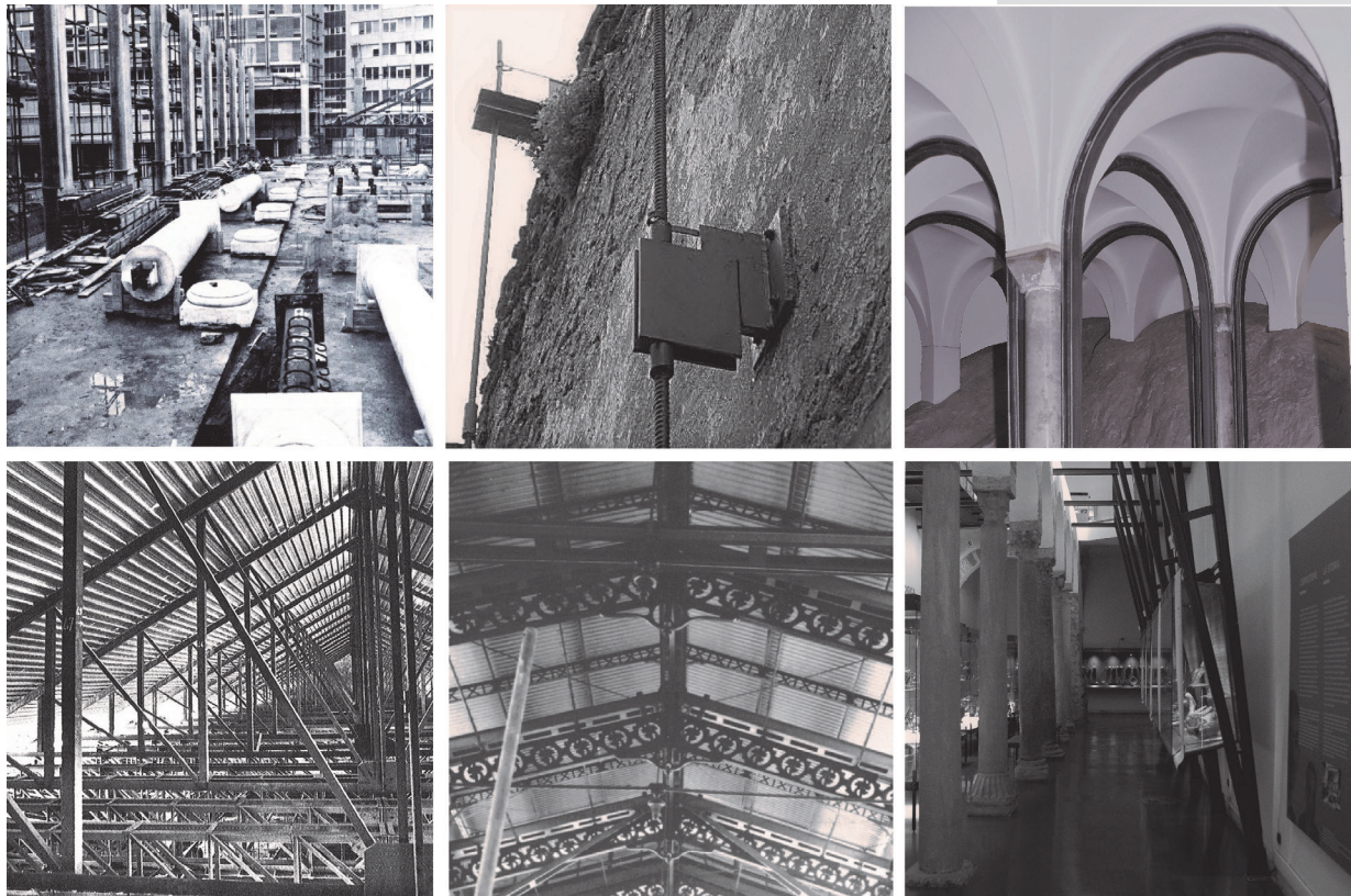
Figure 2. Dissimulation Gradient: total by material subtraction or addition camouflage, whispered by neutral or mimetic addition, denied by structural prosthesis or formal structures.

metallici sono posti a vista, con il compito di soddisfare non solo le esigenze strutturali, ma anche quelle figurative dell'edificio. Di conseguenza l'acciaio è impiegato rispettando non solo le leggi della statica, ma anche le proporzioni e i ritmi dell'antico, ovvero le regole architettoniche che ne